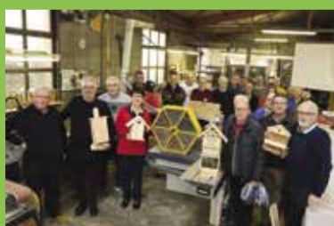
P4 • L'Atelier Banal et la municipalité : des valeurs communes