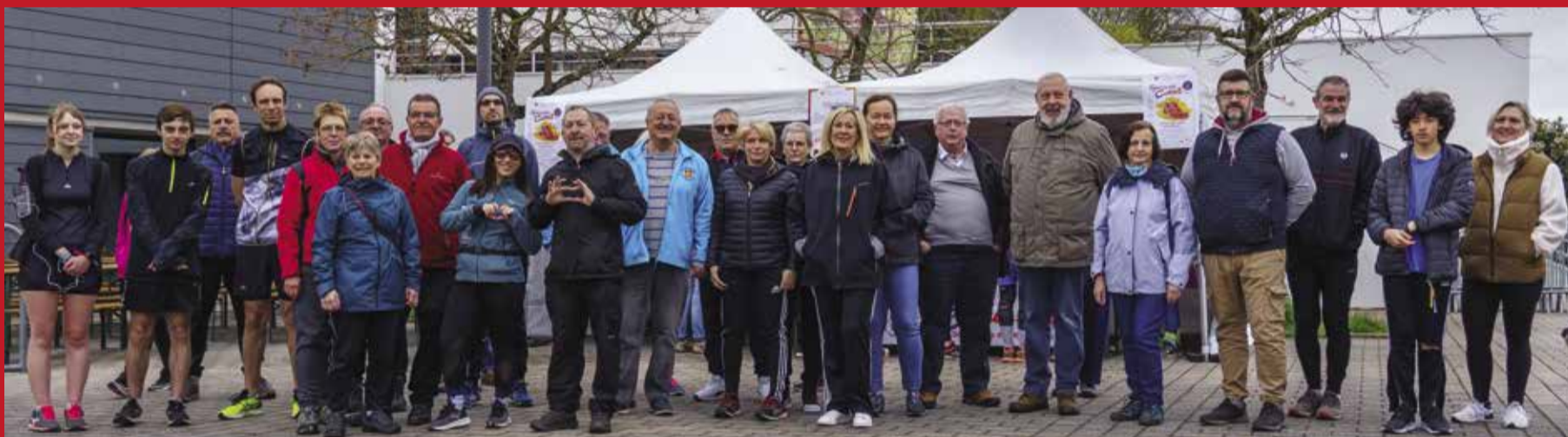
Les membres des associations « Ça marche à Terville » et « Running Trail Tervillois » ainsi que les élus municipaux au top départ du Parcours du cœur.