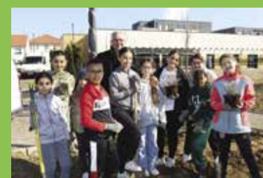
P9 • Nouveau groupe scolaire : le CMJ a participé au chantier