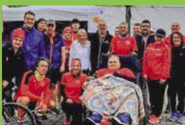
P2 • Parcours du cœur : les Tervillois solidaires