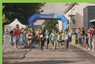
P8 • L'Hemera Trail se tiendra désormais en juin