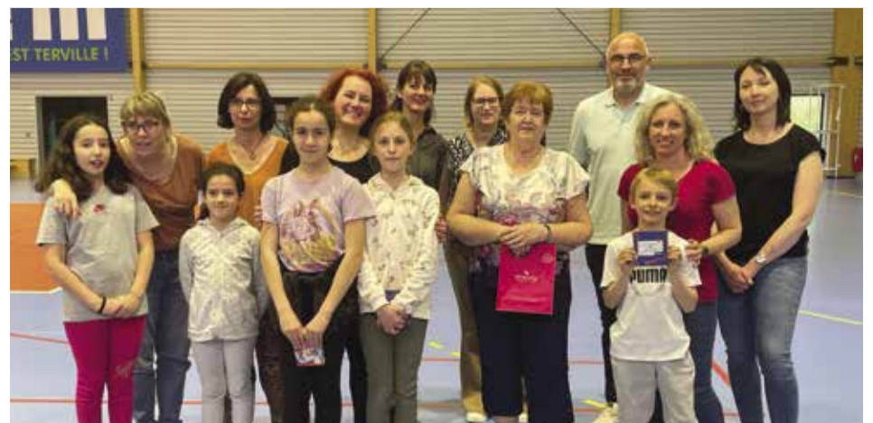
Remise des prix aux gagnants de la dictée Di Gaspivot. Retrouvez le palmarès sur le site www.terville.fr