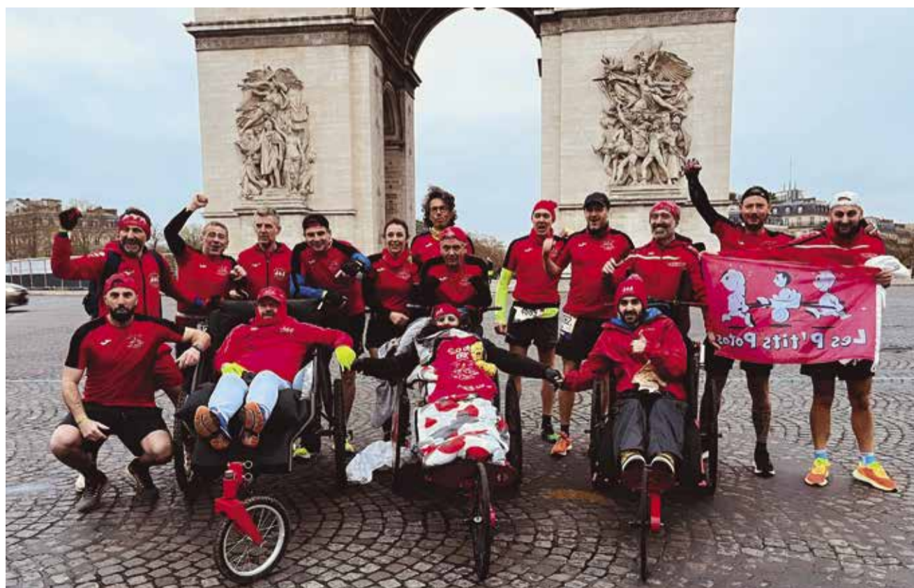
Les P'tits Potos au Marathon de Paris 2023