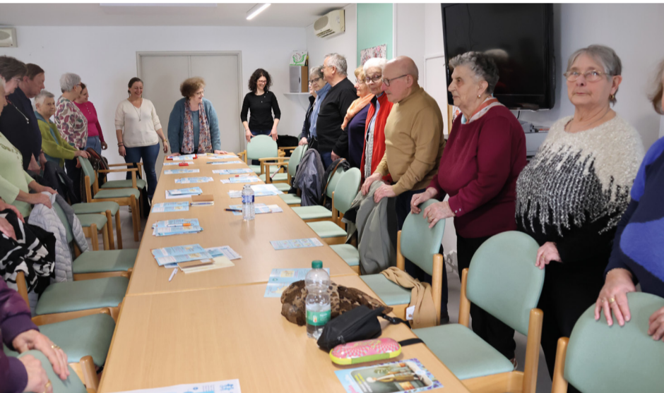
Parcours « Vitalité et harmonie »