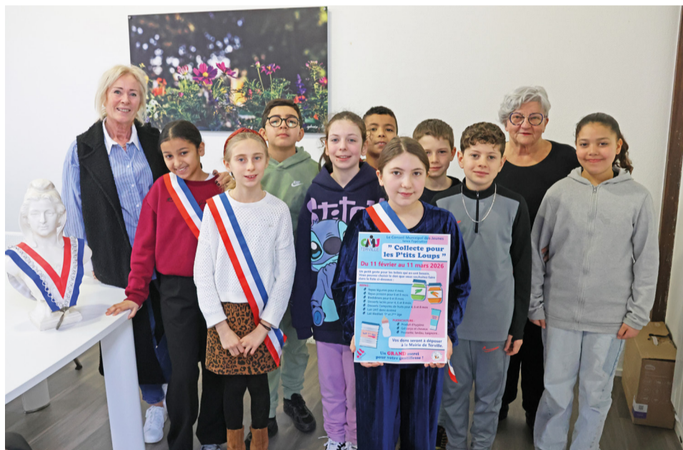
Collecte pour l'association Les P'tits Loups