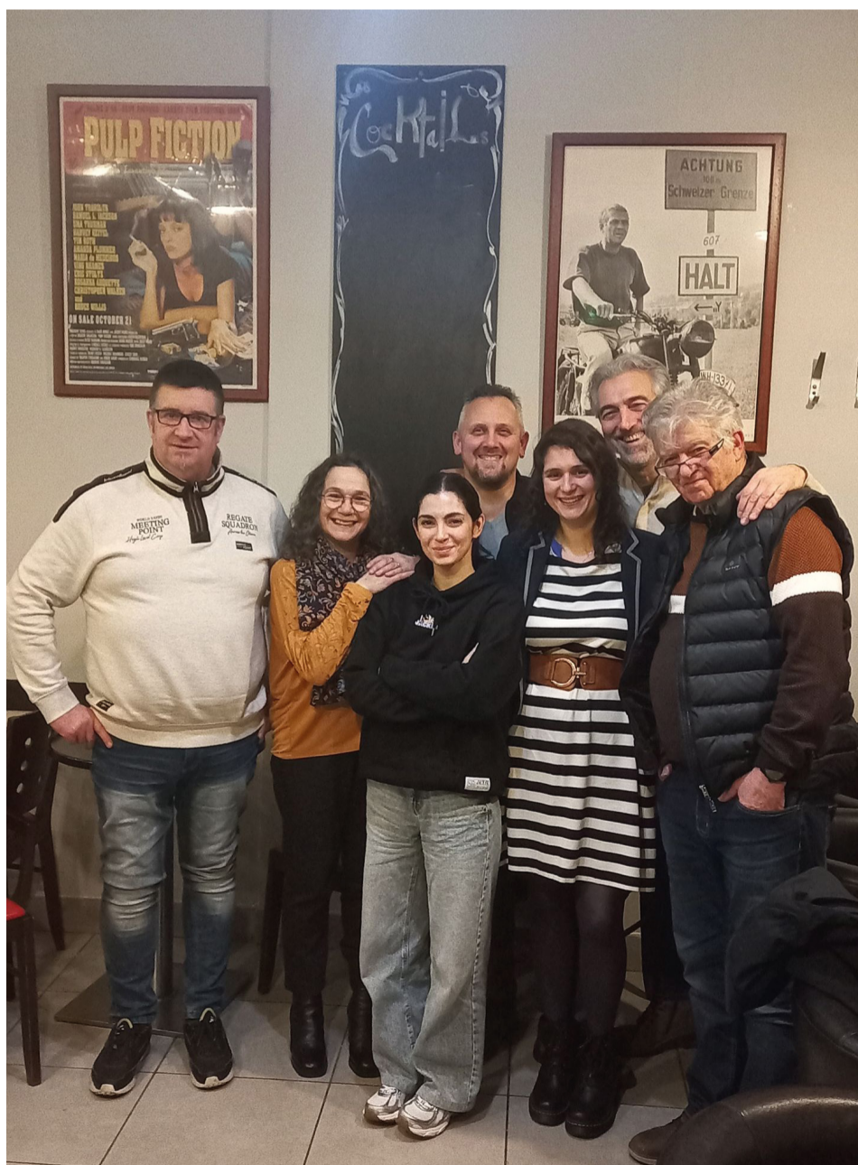
Carnyx en Scène