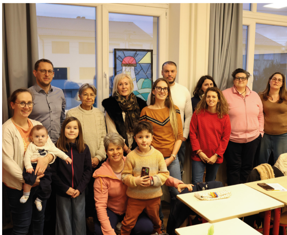
Association des Parents d'Elèves du Moulin