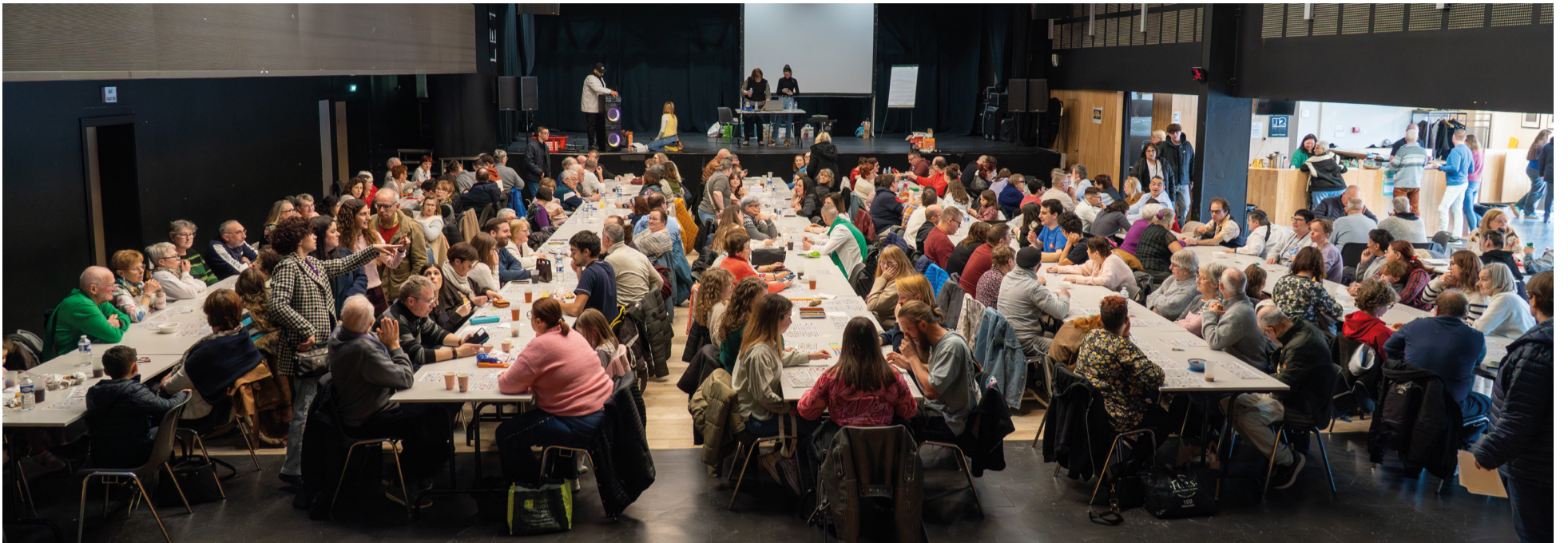
Loto de l'APEI