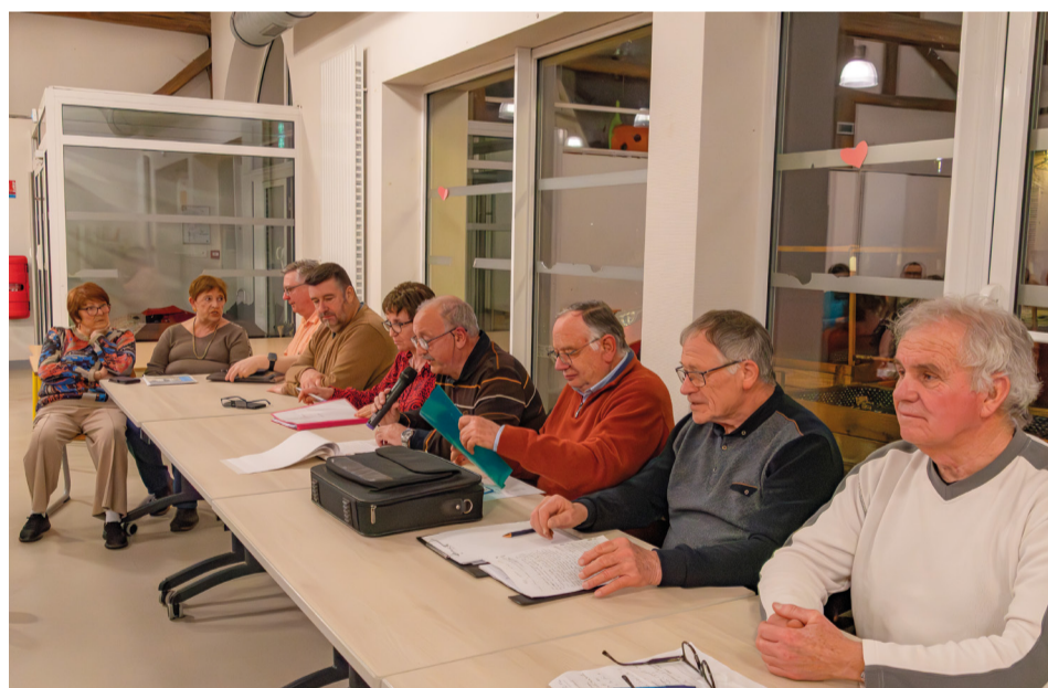
Ça marche à Terville