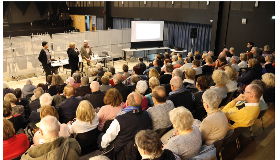
Conférence « À l'attaque des arnaques ! »

L e CCAS de la Ville multiplie les actions en faveur du bien-être et du lien social . En partenariat avec la CPTS Thionville, il a proposé notamment le parcours « Vitalité et harmonie », un cycle de 8 séances dédié au bien vieillir pour les 60 ans et plus. Objectif : prévenir la perte d'autonomie, lutter contre l'isolement et apporter des conseils pratiques au quotidien,