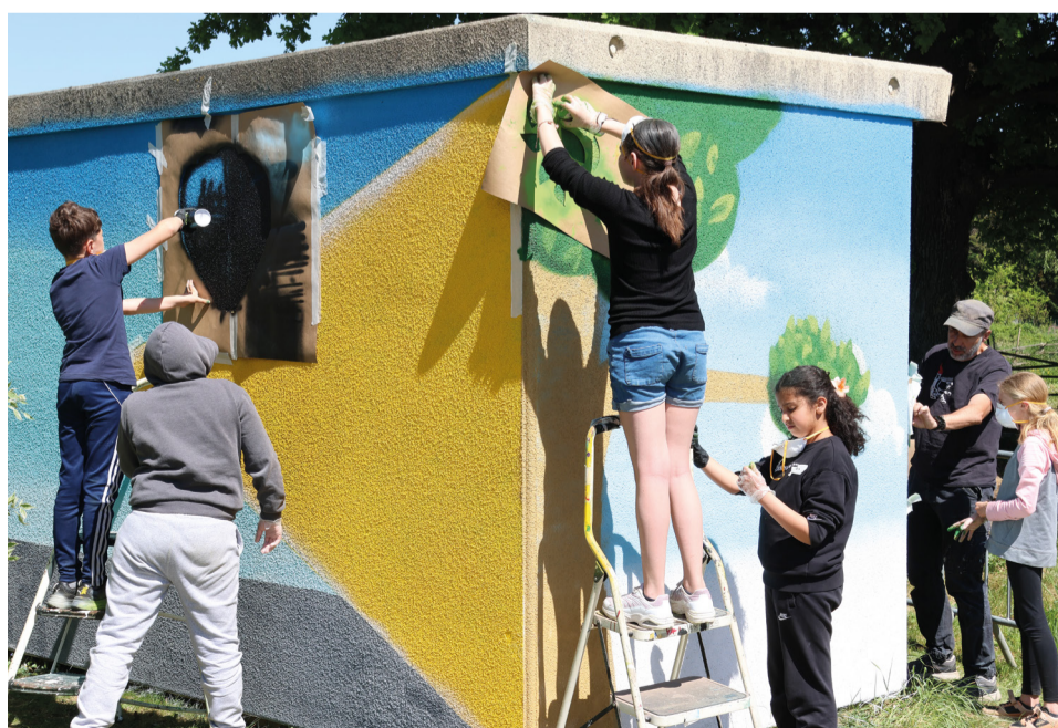
Fresque sur un coffret électrique