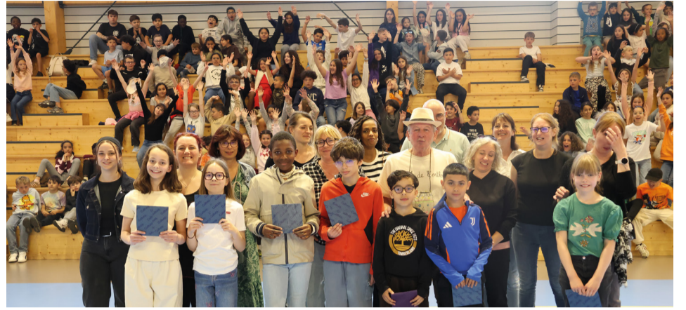
Remise des prix de la dictée Di Gaspivot